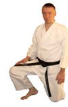
ki ritsu (Steht auf und abwarten)