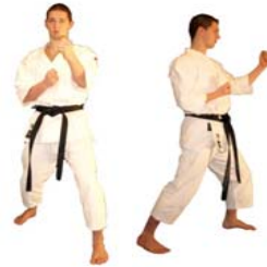
hidari hanmi kamae